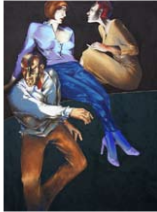
o.T., Öl auf Leinwand, 120 x 90 cm, 2011

1958 in Düsseldorf geboren // verbrachte seine Kindheit und Jugend in Dresden // 1979-84 Studium in Kunsterziehung/Gestaltungstheorie/Malerei/Grafik an der Humboldt-Universität Berlin // seit 1986 lebt und arbeitet Detlef Schweiger freiberuflich in Dresden