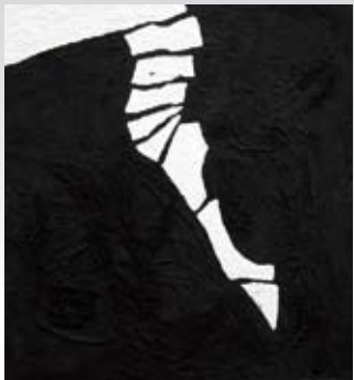
step, Mischtechnik, 130 x 120 cm, 2008

1964 in Hohenbrunn bei München geboren // 1987 Studium in den Fächern Kunstgeschichte und Anglistik an der LMU München // seit 1989 freiberuflicher Bildhauer // seit 2001 lebt und arbeitet HEX in der Hallertau // seit 2011 Mitglied der Royal British Society Of Sculptors