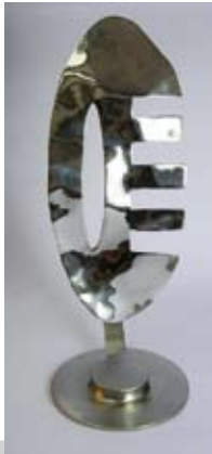
Om-Trance Papersteel, Edelstahl, Höhe 70 cm