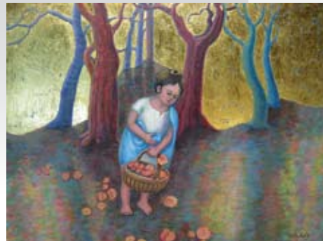
Goddess as child, Ei-tempera, 45 x 61 cm, 2006